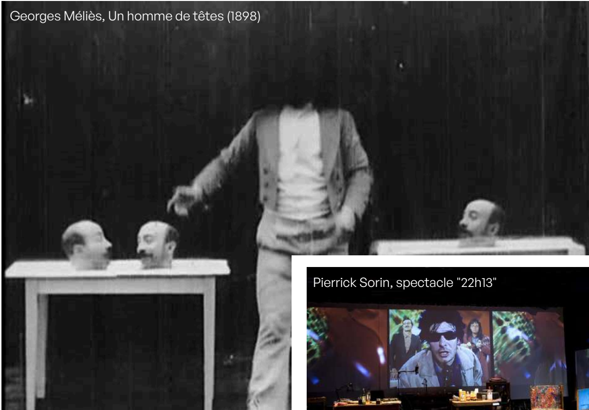
Georges Méliès, Un homme de têtes (1898)