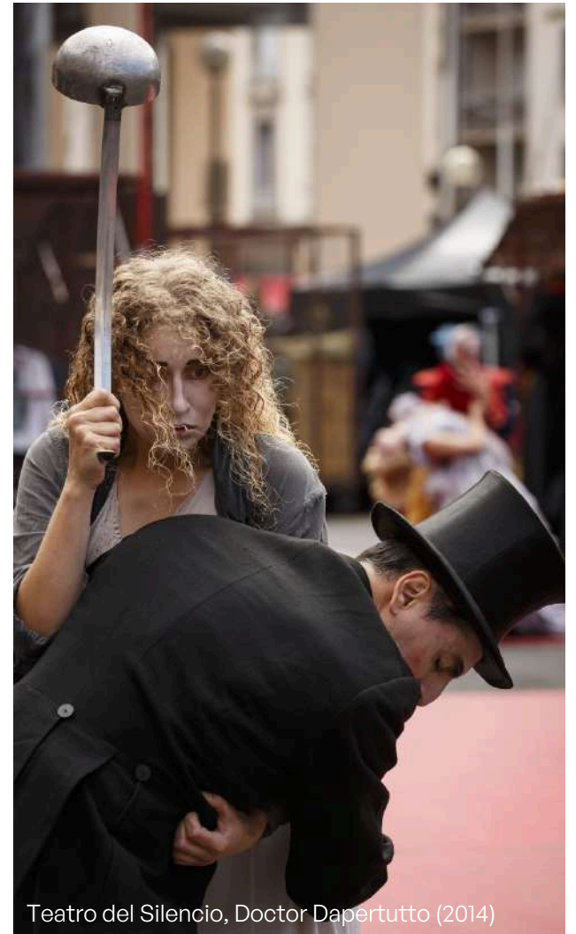
Teatro del Silencio, Doctor Dapertutto (2014)