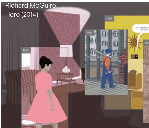
Richard McGuire, Here (2014)